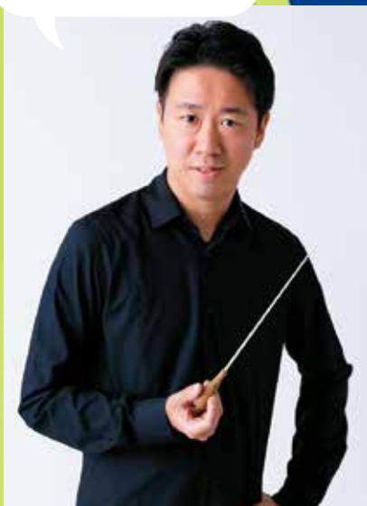
指揮・お話し／名フィル音楽監督 川瀬賢太郎